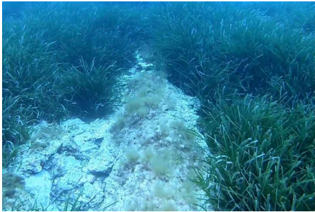
Imagen 3. Fin del tramo enterrado / inicio del tramo apoyado (cota -9 m)