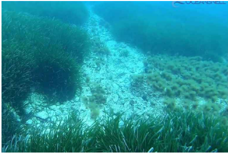
Imagen 2. Afloramiento 2 de conducción semienterrada (cota -7,1 m)